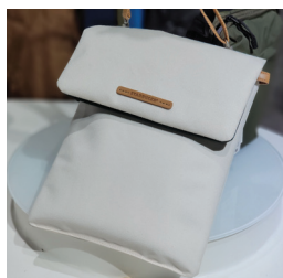
The product with application of Cotna640D fabric